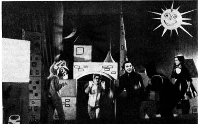
Scenă din actul II — Tea- trul de Stat din Piatra Neamț

Și Ion Cojar, și Lucian Giurchescu au greșit în spectacolele lor cîte o singură dată și în același loc, lăsîndu-se ispițiți de prilejul oferit de text de a parodia un spectacol de circ. Această slăbiciune a textului, care oprește în loc acțiunea propriu-zisă, a fost preluată de regizori și chiar dezvoltată, prilejuind o de-