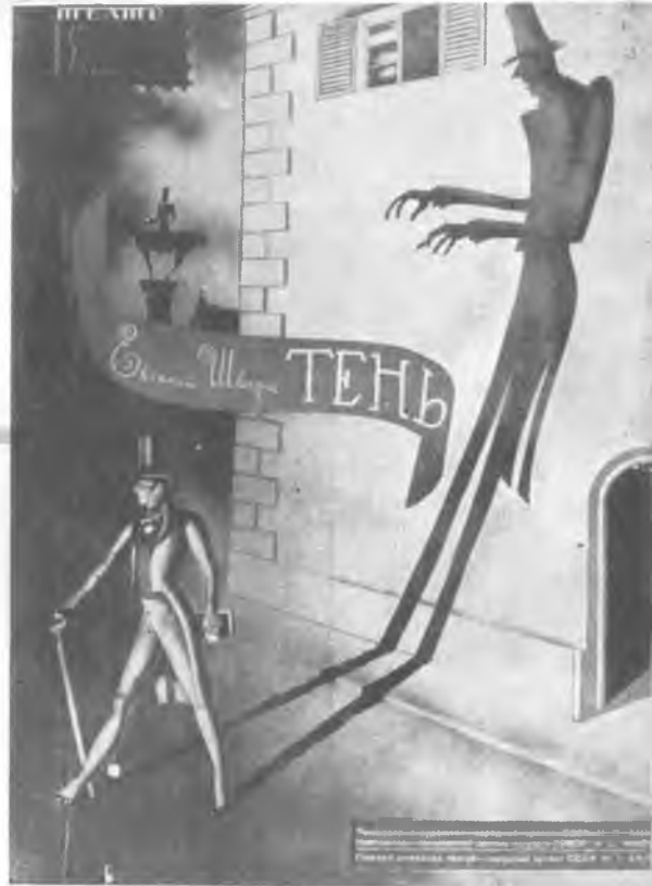
Afișul spectacolului „Umbră” la Teatrul de Comedie din Leningrad

Mai tîrziu în lucrările sale dramatice E. Svarț a dezvoltat și a impus cu deosebită pregnanță originalitatea talentului său căci, nefcînd niciodată de a fi un povestitor, E. Svarț este în fiecare din piesele sale un polemist necrușător. Această caracteristică a artei sale se vede foarte