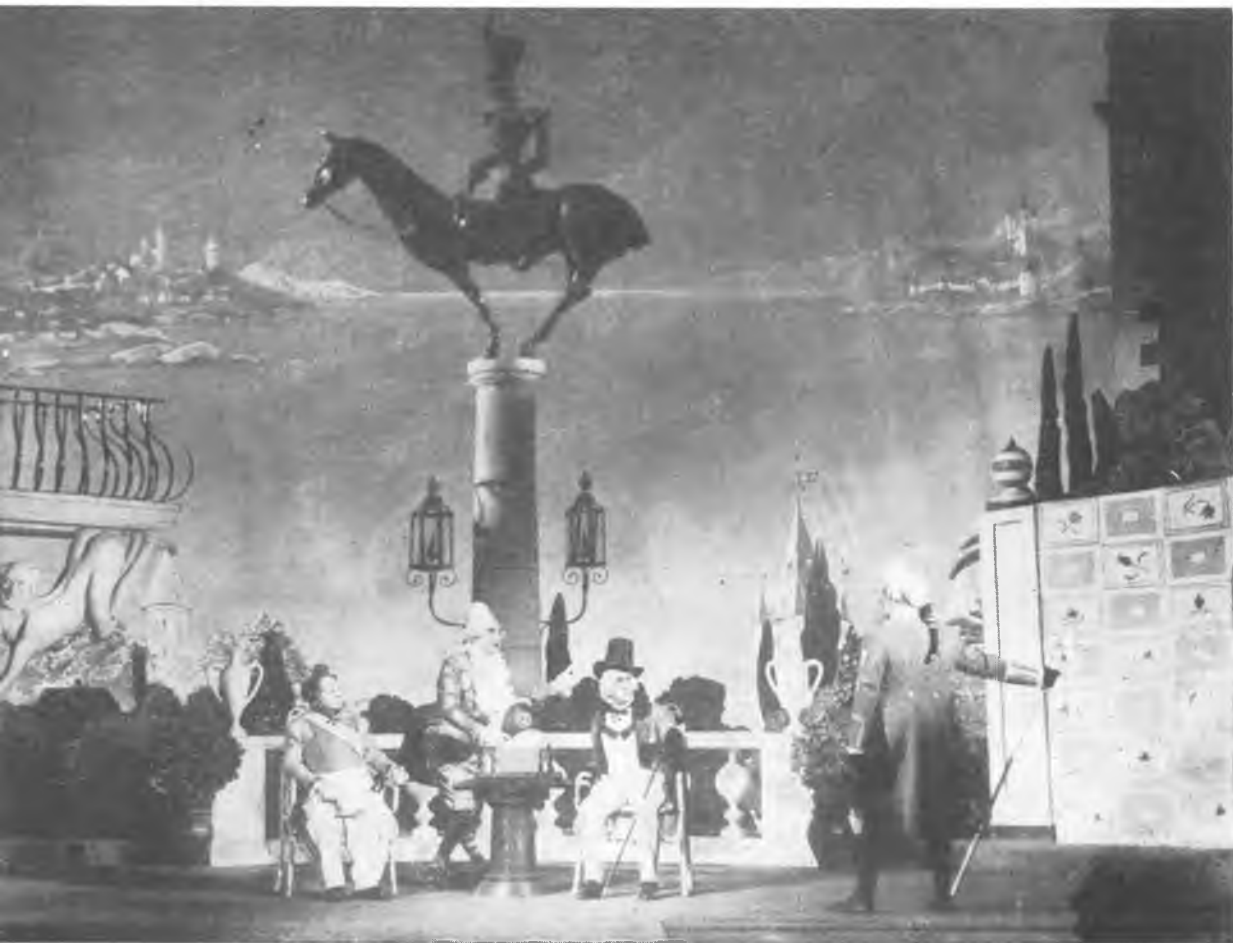
Scenă din spectacolul „Teatrului de Comedie“ din Leningrad

formală față de nevoile de fiecare zi ale oamenilor dacă nu o atitudine ostilă față de programul de viață al societății noastre? Ce înseamnă intriga, spiritul circotaș, calomnia, birfa, dacă nu o luptă activă împotriva formelor noi ale vieții noastre, dacă nu o încercare de a frâna munca vie, constructivă, o încercare de a distruge relațiile ce se formează între oamenii pe care îi reunește un ideal nobil? Probabil că purtătorii „viciilor mărunte” adesea nici măcar nu-și dau seama de originea acestor defecte alit de supărătoare pentru cei din jur. Autorul învinuit de plagiat poate, probabil, să citească foarte liniștit date în legătură cu politica colonială a unor puteri capitaliste, fără să bănuiască că între această politică și propria lui practică există ceva comun: tendința de a trăi pe seama altora.