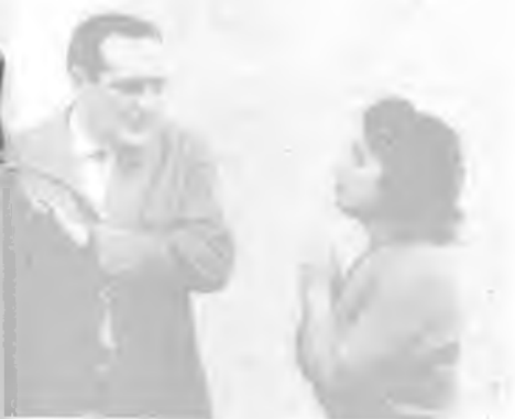
a Șeptilici s. za Ploeanu