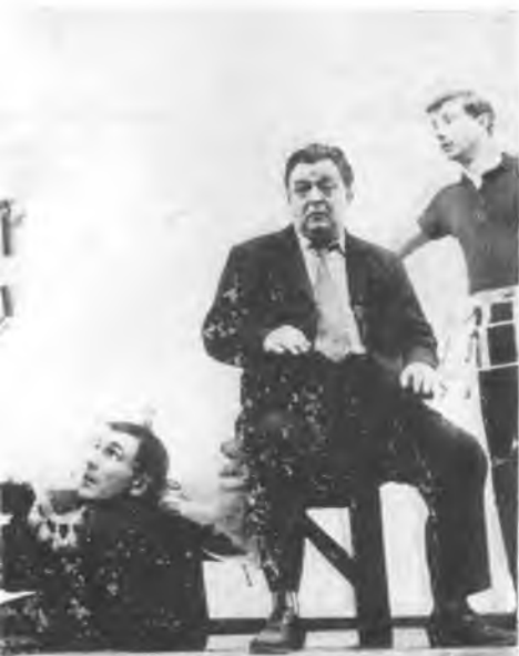
ghe Dinică mitru Chesa