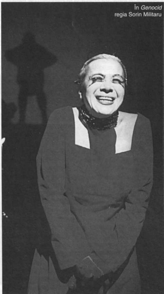
În Genocid regia Sorin Militaru

C.B.: Pentru mine, experiența a însemnat enorm. Am jucat pe mari scene ale lumii, la mari festivaluri. A fost o șansă la care n-aș fi sperat niciodată. Dar a fost și greu. Departe de a fi o producție turistică, un produs de export, cum au zis unii, eram toți foarte solicitați. Personajul îmi impunea un regim special de alimentație, de somn. Stăteam pe scenă, timp de 40 de