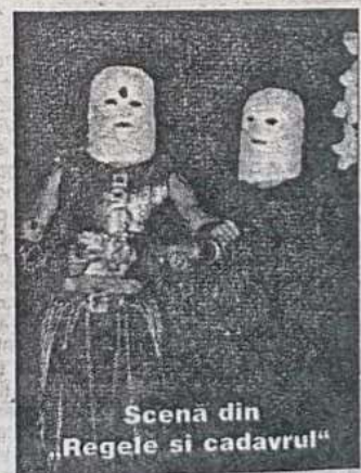
Scenă din „Regele și cadavrul”