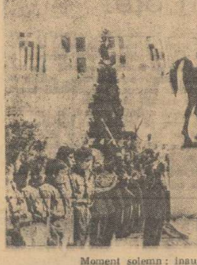
Moment solemn: inaugurarea monumentului.

Apărute: o piață înfățișată de lumee, flori, drăpela jîturind, fîntînă, școli școlite în pelerină și oficialii incrementați în solemnă așteptare, stăruind generalului Decavalia, eroul luptelor pentru independență, în praștia dezvelirii și la fereastra unei case însuși generalul, în tunec de gală, cu chipul mîndru împodobit cu pene, eroul corbit din paginile manualului de is-