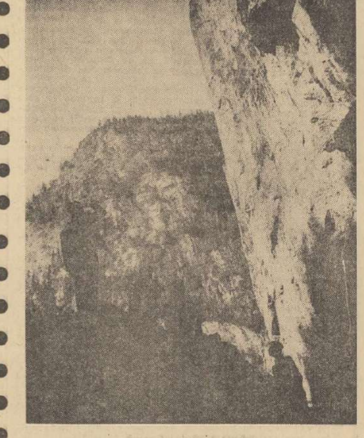
Popas la cheile Bicazului