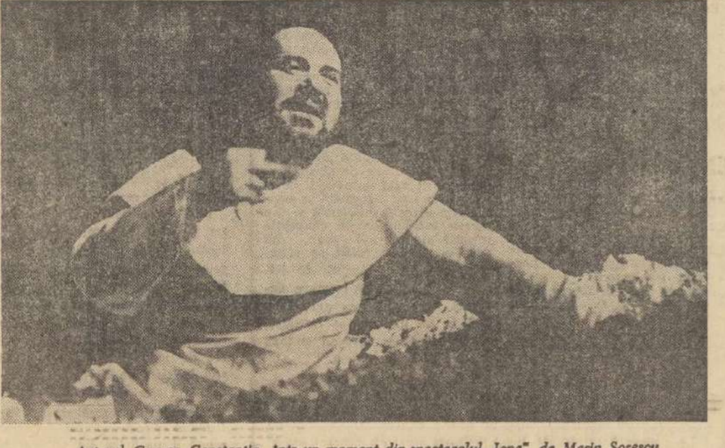
Actorul George Constantin, într-un moment din spectacolul „Iona” de Marin Sorescu