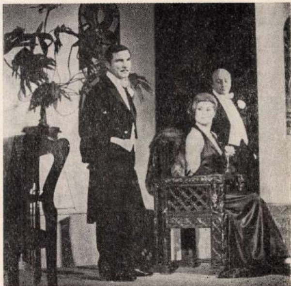
Jos : Gheorghe Dinică, Florina Cercel și Marin Moraru